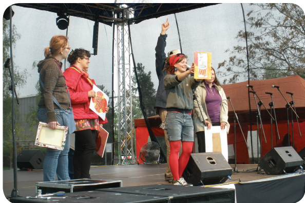
Dražba obrazů z Ateliéru (duben 2013, Centrální park Pankrác, Praha 4) V rámci již tradičního pálení čarodějnic uspořádal Ateliér dražbu obrazů klientů.