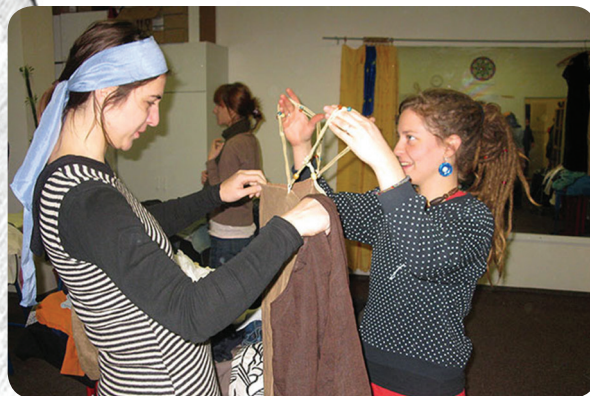
Baobabí bazárek (listopad 2013, Baobab) Tradiční podzimní bazárek šatstva a doplňků se konal ve spolupráci se společností Forewear, která se ujala nerozebraného oblečení, ze kterého vyrábí obaly na knížky a diáře! Takže recyklujeme. www.forewear.cz