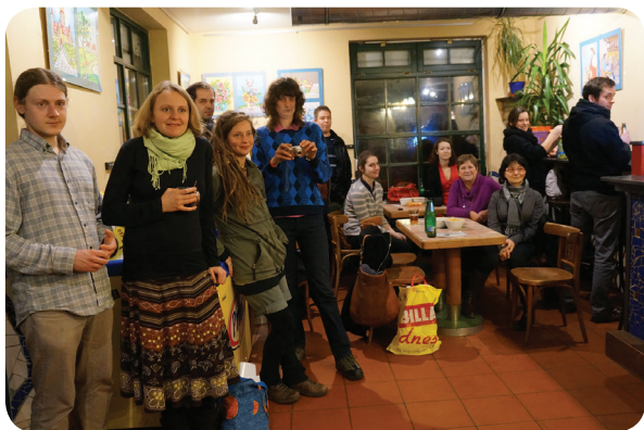
Vernisáž výstavy klientky ateliéru Márie Pintérové Barevný svět (prosinec 2013, Café na půli cesty, Praha 4)

Služba podporuje realizaci těchto výstav s cílem otevřít širší veřejnosti „svět duševního onemocnění“ a zvýšit tím destigmatizaci lidí, kteří duševním onemocněním trpí. Zároveň tím podporuje klienty k větší samostatnosti a zlepšení jejich sebevědomí.